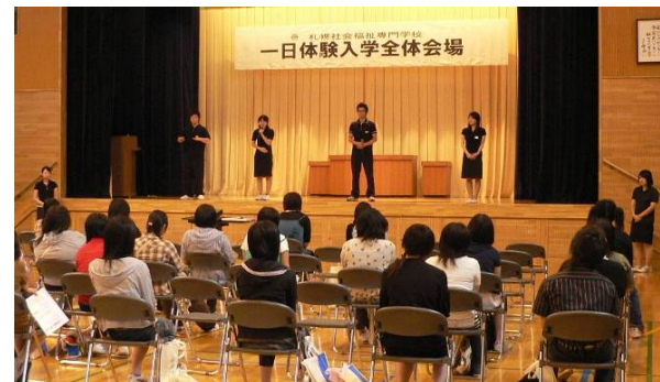
● 手話のアトラクション

札幌市内をはじめ、全国各地から大勢の高校生や保護者の方が参加。本校の在校生を中心に手話・介護・保育の体験を通して、どんなことを学んでいるのかを伝えることが出来ました。参加者の皆さんも最初は少し緊張気味でしたが、帰るころには在校生と笑顔で会話を交わしており、本校を理解していただいた良い一日となりました。