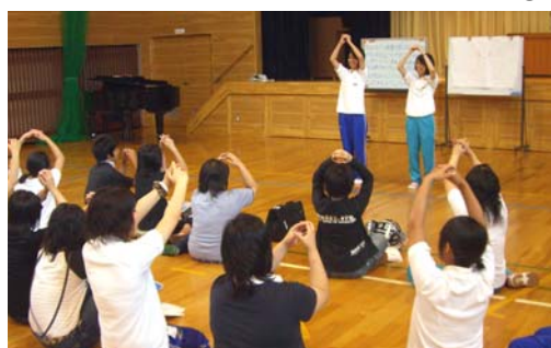
● 保育の手あそび体験